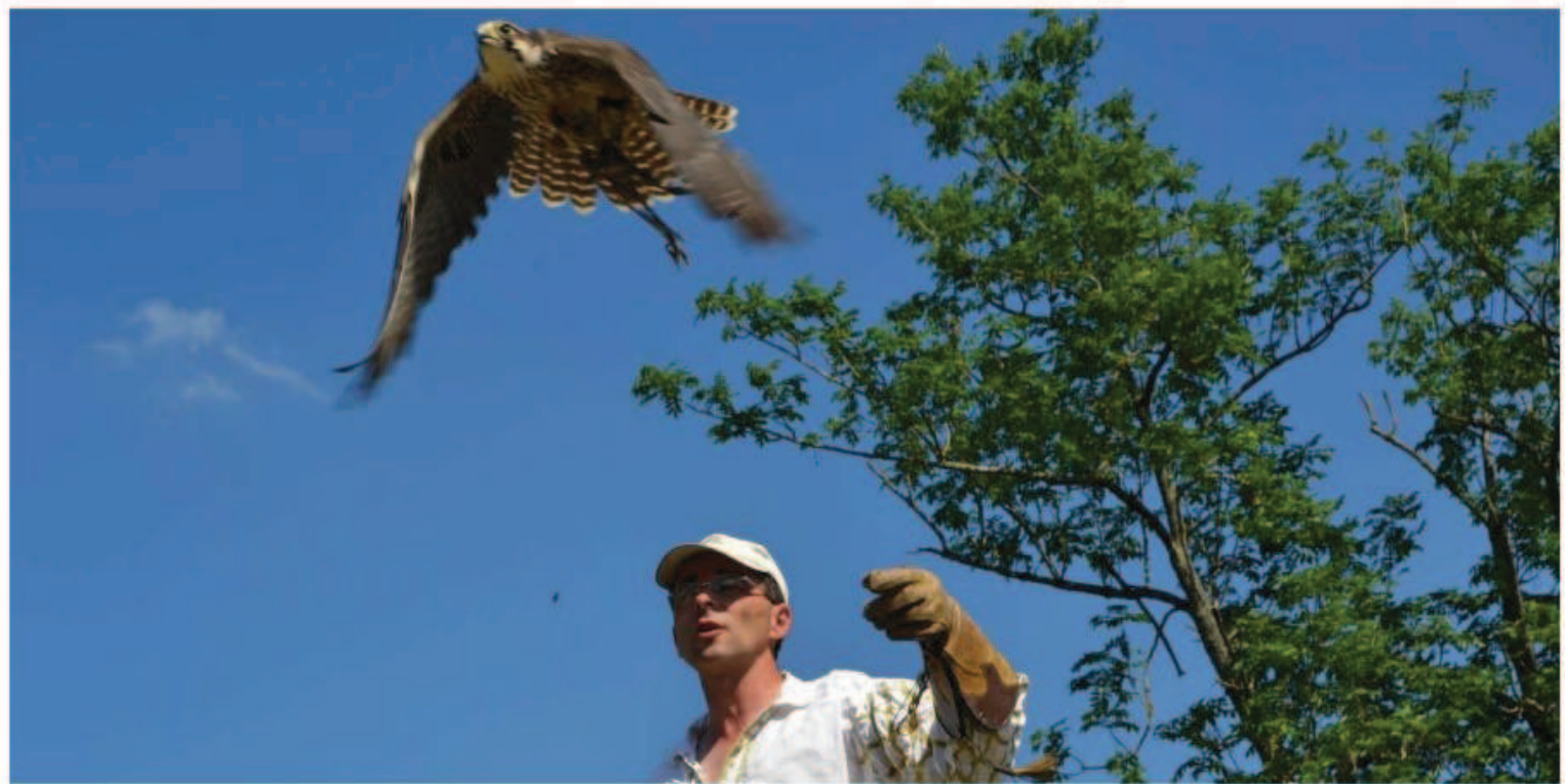
▲ La municipalité souhaiterait installer une fauconnerie. ©ILLUSTRATION "SO"

La Ville réfléchit à de nouvelles méthodes de régulation du pigeon, à savoir le pigeonnier contraceptif et la création d'une fauconnerie